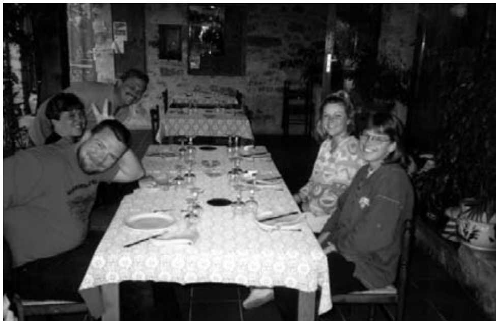
Restaurant Bialov ved Camping Moto.

med dette cykelløb og i Frankrig er det en hel folkefest, hvor alt andet går i stå. Vi havde parkeret på en lille bjergvej tæt ved ruten, men det var der ca 7496 biler der også havde gjort, så da vi skulle hjem var alle veje fuldstændig lukket af biler.