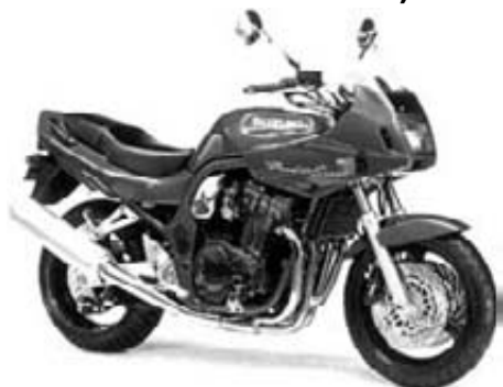
GSF1200ST kr. 114.975,-