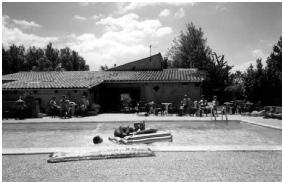
Pølen ved Camping Moto.