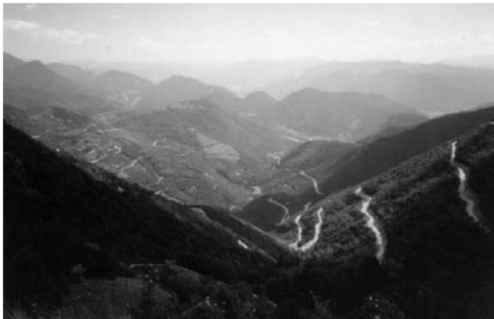
Udsigt til gasvej.