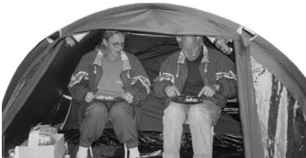
Ikke alle kunne sidde oprejst og spise.

andre må siges at have nogle mere primitive boligforhold.