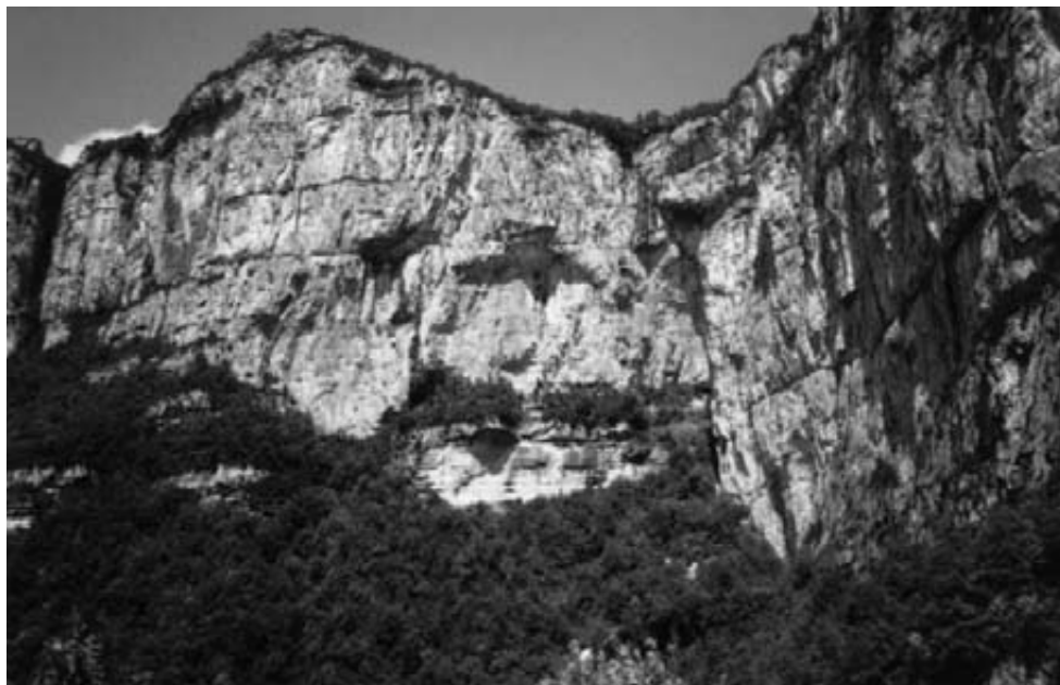
Landskab ved Camping Moto