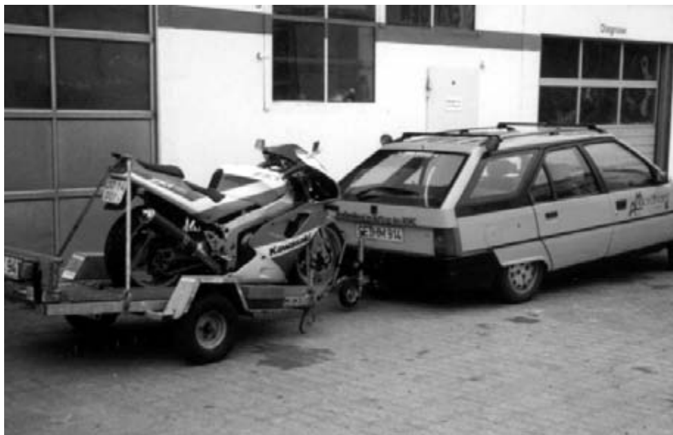
Et yderst sjældent syn.