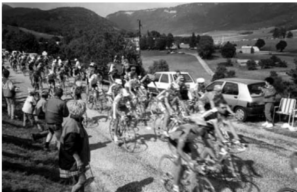
Tour de France.

til Frankrig og overnatte på et hotel for motorcyklister nordvest for Strassbourg. Hotellet var ikke lige til at finde men det var heller ikke den bedste beskrivelse, der var i Touring Nyt . Efter et par timer fandt vi hotellet, som varmt kan anbefales. Det koster ca. kr. 140,- pr. person at overnatte incl. morgenmad. Værelserne er store og indehaverne er utrolig flinke.