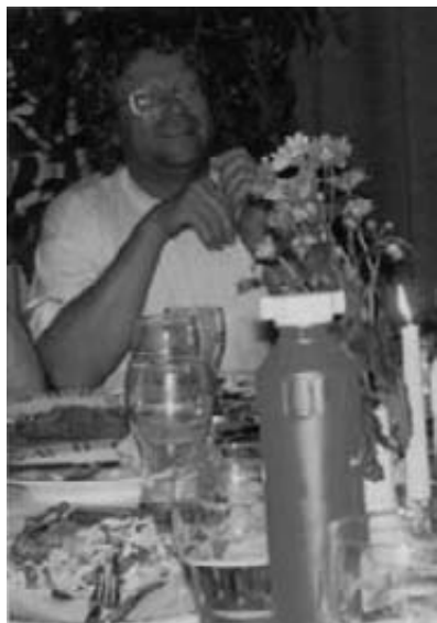
Der må jo skabes ligevægt!

rumplads havde vi og kunne i modsætning til andre sidde oprejst og spise vores mad. Ligeledes havde vi den fordel at have medbragt et tæt telt, hvor