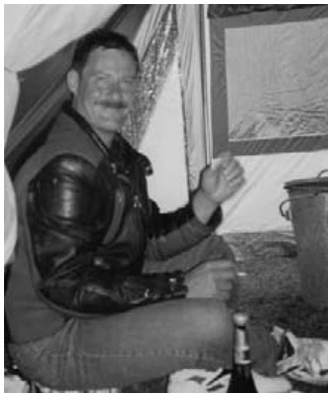
Nogle havde mere primitive forhold end andre.