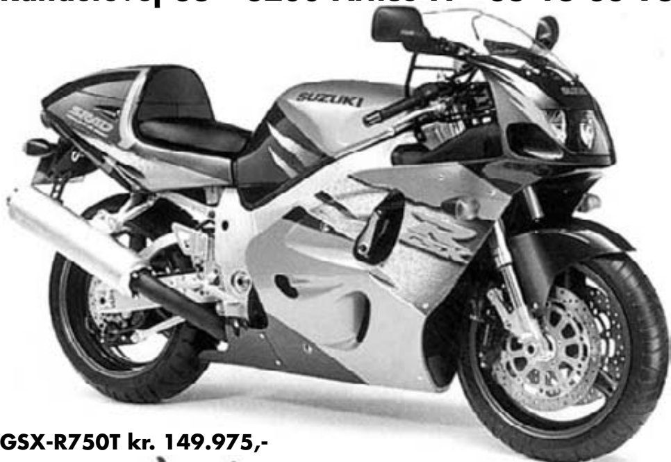
GSX-R750T kr. 149.975,-

Randersvej 36 - 8200 Århus N - 86 16 33 96