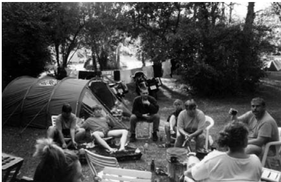
Stemningsbillede fra Camping Moto.