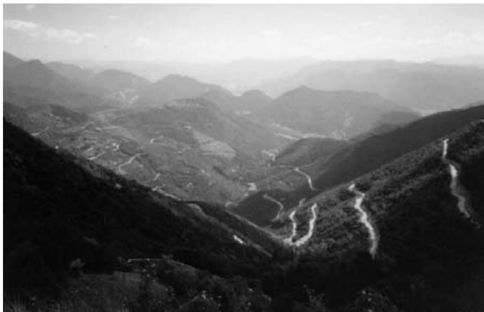
Udsigt til gasvej.