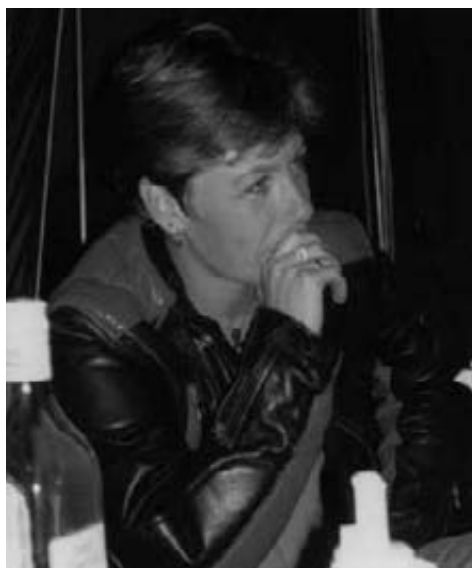
MC Højbjergs stærke kvinder