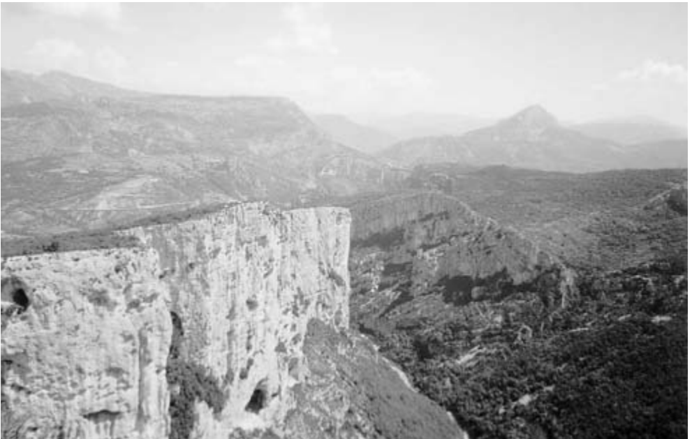
Verdun kløften, Grand Canyon.