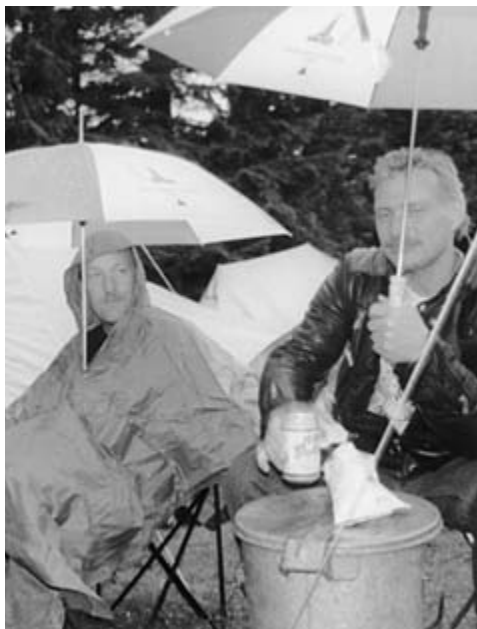
Da vi tilmeldte os til træffet, fik vi en paraply.

Da vi tilmeldte os til træffet, fik vi en paraply fordi det var det 30.