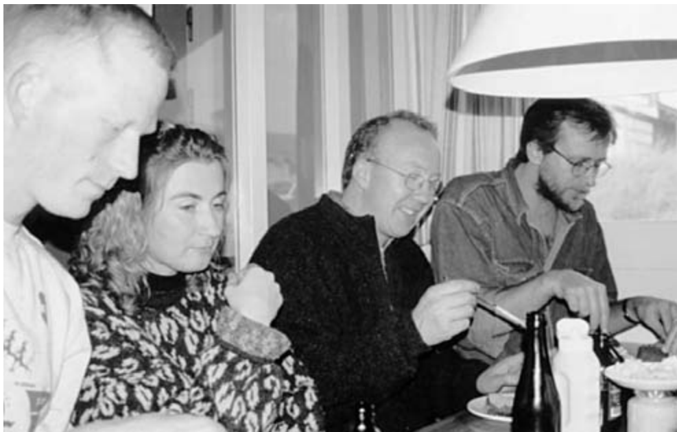
Uden mad og drikke.....