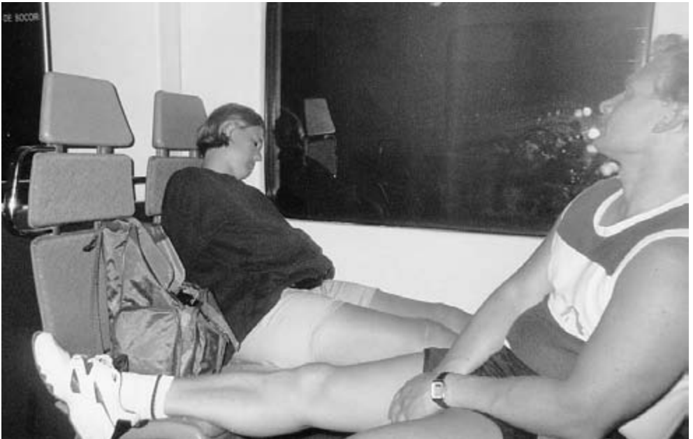
Trætte turister på vej fra Barcelona.