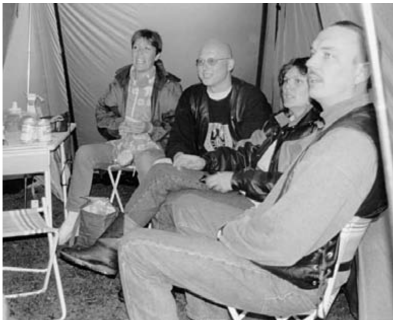
Telthygge er ikke det værste vi har, især i regnvejr.