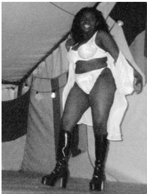
Den varme negerpige.

Mandag morgen, nu skulle der tjekkes olie, Hondaen laver olie mens Yamahaen bruger det. Næste stop blev Annecy, hvor det skulle være smukt, og det er det. For at nå Annecy er der et par små bakker som skal passeres og når den højeste bakke man har set er Ejer Bavnehøj, bliver man en smule overrasket, på kortet er turen ikke så lang, men kortet snyder, ved 22-tiden så vi os