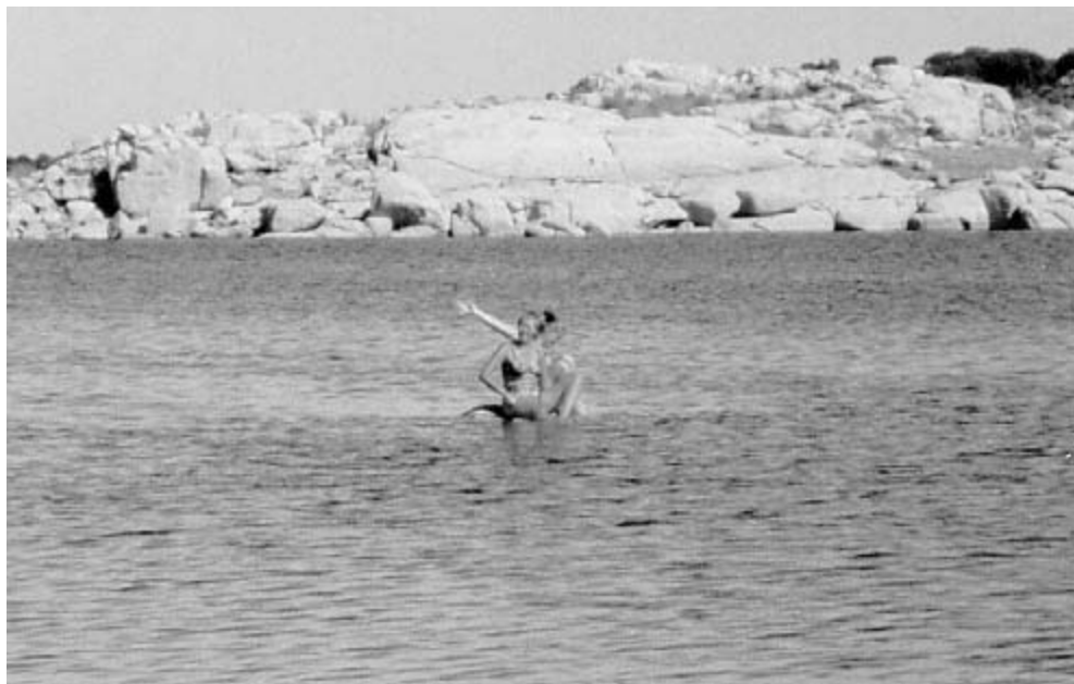
Søstrene Kannerup tror de kan sidde på vandet.