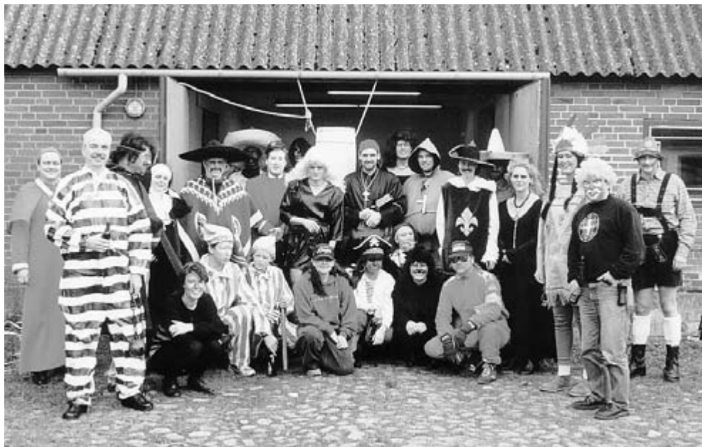
Hele forsamlingen med den stadig intakte tønde i baggrunden.