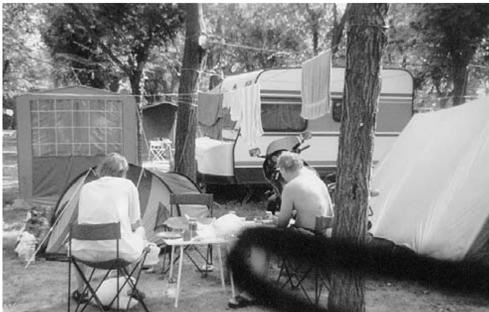
Camping i Blanes.