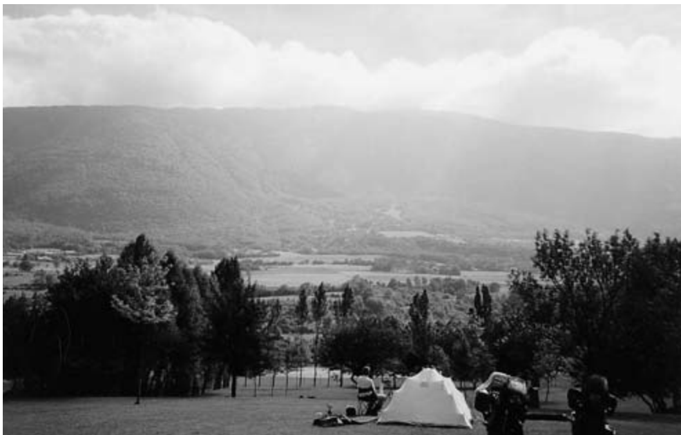
Morgen i Frankrig.

dame har hørt om stedet, vi skulle bare lige udenfor byen, ca 5 km og så til venstre og vi ville ikke undgå at finde det. Ankommet til Moto, er der nogen vi kender, og hvem gemmer sig i skyggen, nogle MCH'er og nogle Valby'er, hvis ikke du har været der skal du prøve det, lækkert område og en dejlig kølig pool på pladsen, vi bliver to overnatninger, men så kan M-L ikk vente længere, nu står der Spanien i øjnene på hende og på vejen skal vi lige se det franske svar på Grand Canyon, det kræver en overnatning mere i Frankrig, men det er det værd. Nu er der kun et sted på Yamahaens gashåndtag og næste stop skulle være Blanes, men Hondaen får en omgang akut strømsyge ved en fransk motorvejsbetaling, ind til siden og jeg tror det var heldigt at franskmænd ikke forstår dansk for det var ikke pæne ord som faldt ud af min mund, men det var