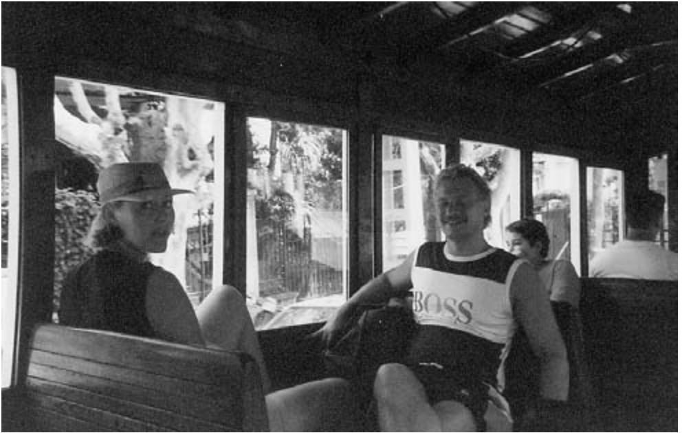
Turister i Barcelona.