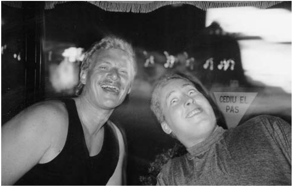
Et par berusede MCH'er i Blanes.