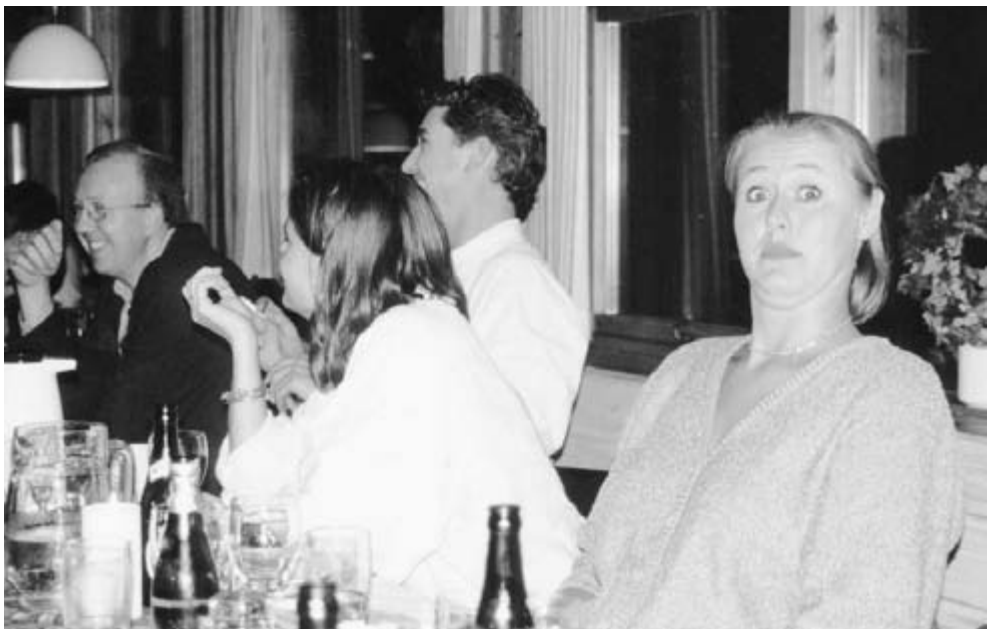
Hvem? Mig? Skal mit billede i bladet?