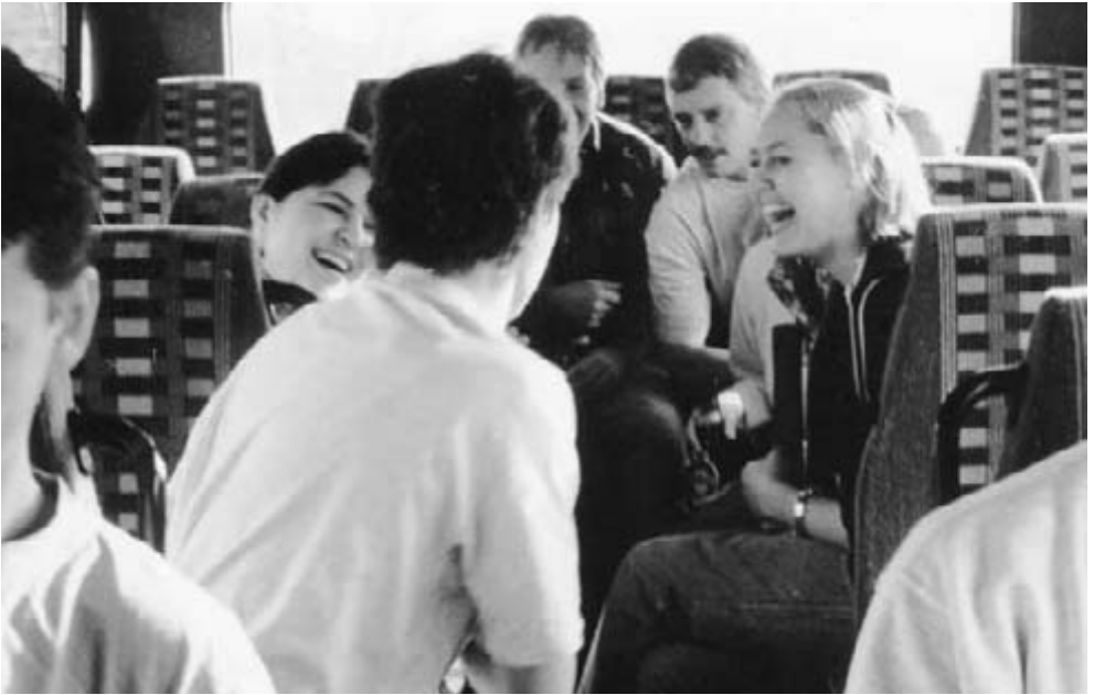
I bussen er der sjældent kedeligt. Løgnehistorierne nærmest vælter ud af folk.