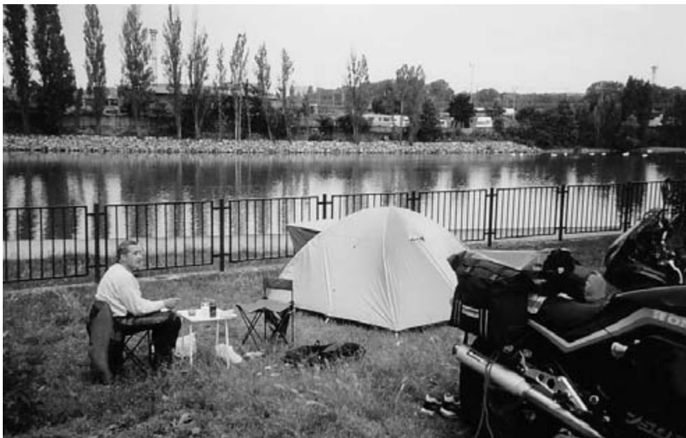
Overnatning i Thionville.