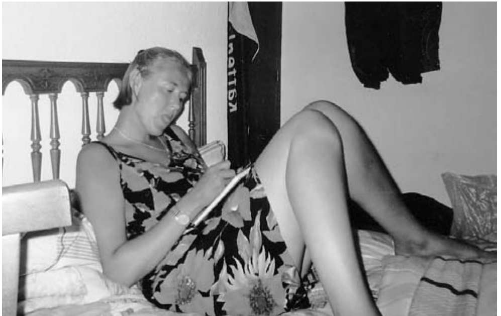
En MCH'er i Salamanca.