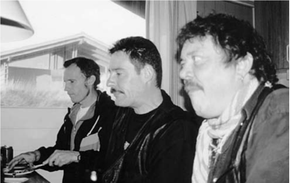
.....et fast indslag er frokosten efter ankomsten.