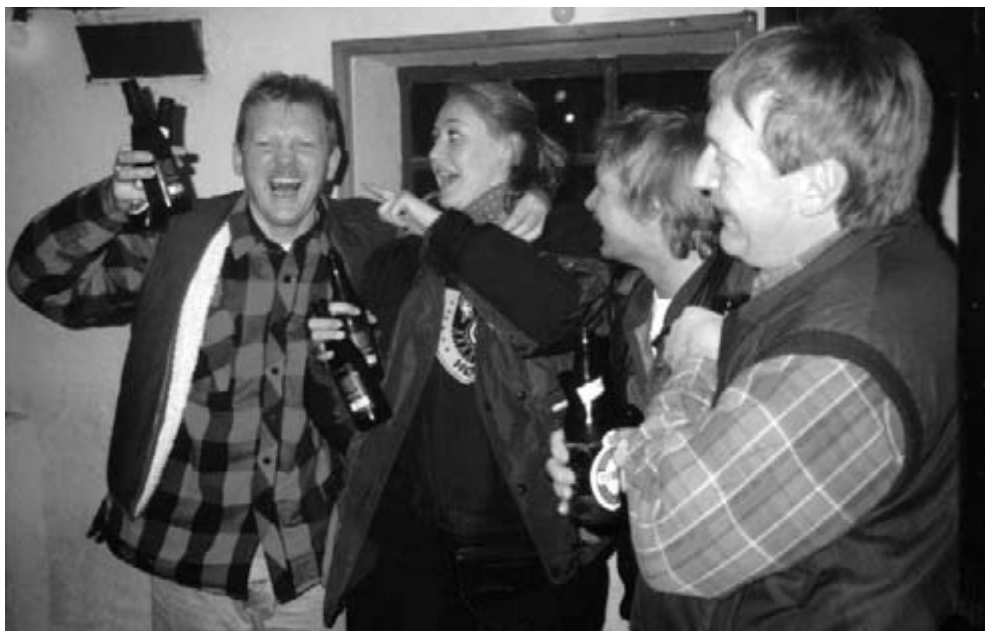
SKÅL FOR SATAN!! (Igen)